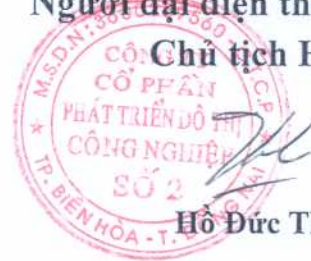
Hồ Đức Thành